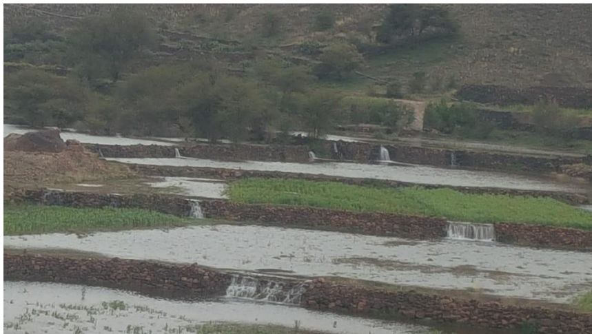
لوحة ١٧: نماذج من المدرجات الزراعية وطرق ريها ومحاصيلها.