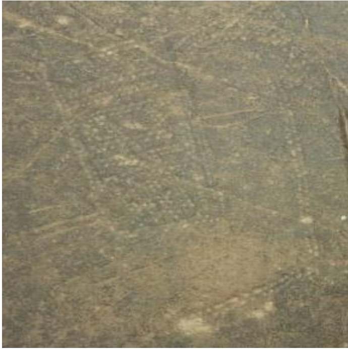
لوحة ٢: رسم صخري لقصر قديم لعله المسمى ذي ينعم وحوله بساتين.