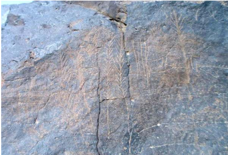
لوحة ٣: رسم صخري لسنايل القمح اليمني القديم.