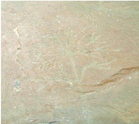
لوحة ٤-٦: نماذج من الفن اليمني القديم لعناقيد وأفرع وأوراق أشجار العنب والنخيل.