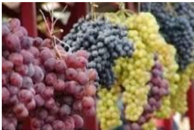
لوحة ٧-٨: نماذج من أنواع العنب اليمني: الأبيض والأسود والأحمر