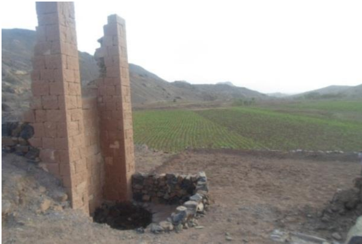
لوحة ٩-١٦: نماذج من بقايا منشآت الري الزراعية الجرتية القديمة.